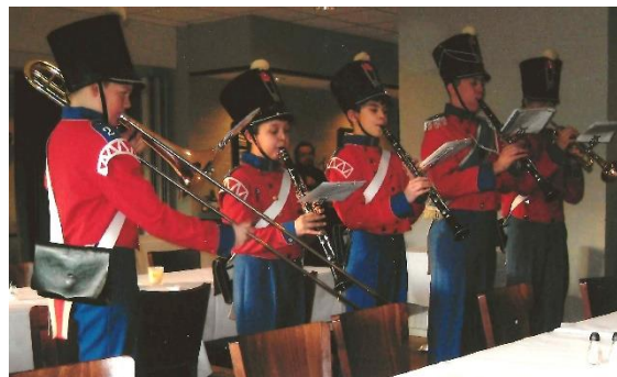
"6. Juli Garden" spiller ved Gurlis fødselsdag.