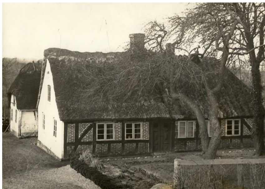
Ejendommen i landsbyen, Smidstrup, Nørre Sandager sogn.