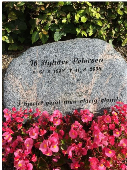
Dødsannonce fra avisen.