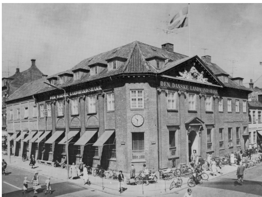
Den "Danske Landmandsbank" på hjørnet af Gothersgade og Jyllandsvej i Fredericia.