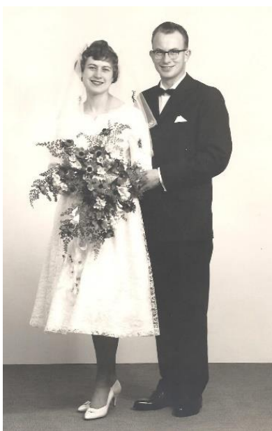
Brudeparrets officielle bryllupsfoto.

Yderligere oplysninger: a) myndighedernes attest om beviselighedens orden: Borg. I Middelfart den 19. marts 1960 Jn (journal nr.) 10/60. e) folkeregister: 19/4 1960 – Vesterbrogade 44, Fredericia.