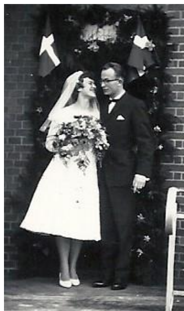
Bruden og brudeparret foran æresporten ved brudens hjem, Odensevej 92, Middelfart.