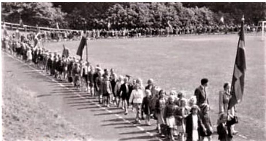
Idrætsdag, Vestre Skole – eleverne marcherede samlet fra skolen og ind på stadion før starten af de enkelte discipliner (foto fra midt 1950'erne).

Skolen var også arrangør af en årlig idrætsdag. Den indledtes med, at alle elever, klassevis, marcherede til Middelfart Stadion med skolens fane i spidsen og med de enkelte klassers flag foran hver enkelt klasse.