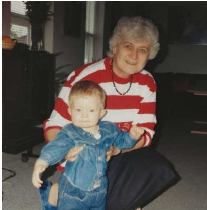
Gurli har ofte tjansen som barnepige.