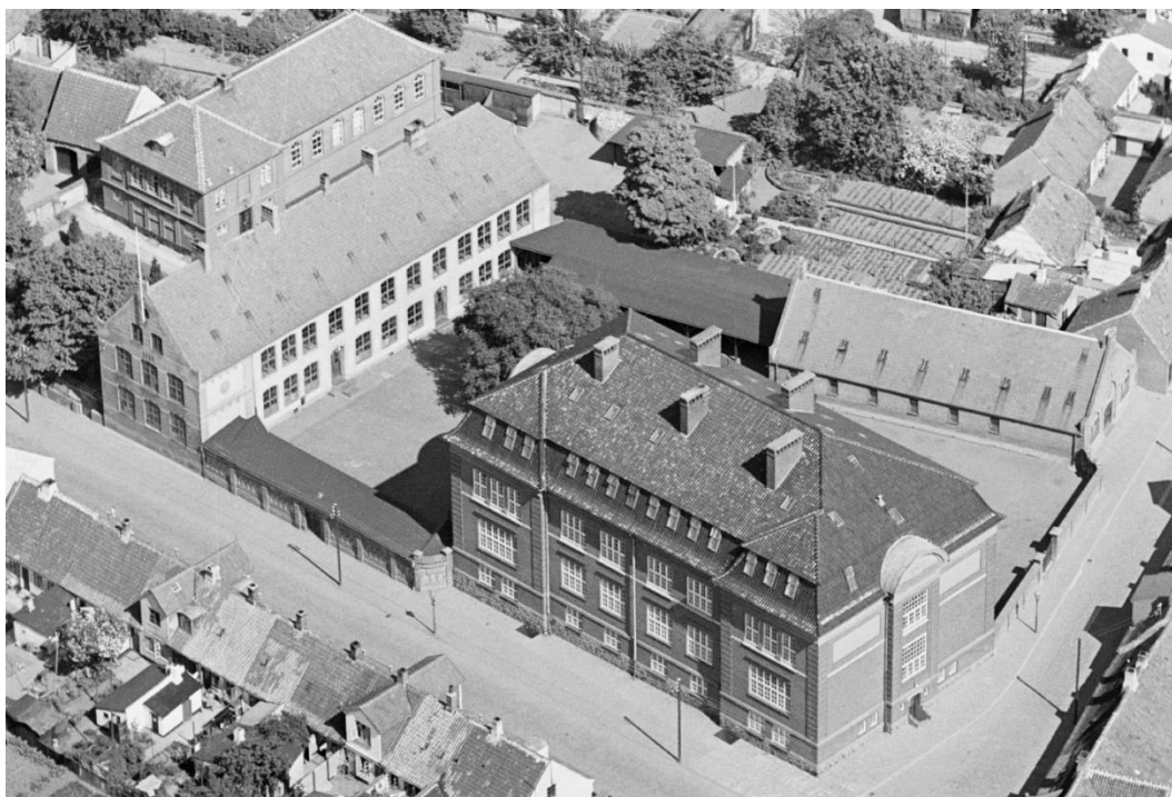
Luftfoto af Middelfart Kommuneskole (1939). Fra 1952 omdøbt til "Vestre Skole", da en ny kommunal skole, "Østre Skole" var blevet opført i den østre bydel.