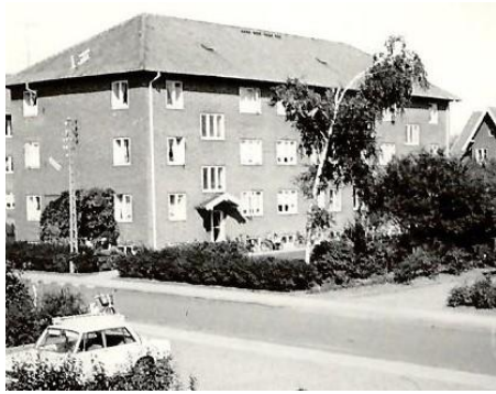
Ejendommen på Indre Ringvej.