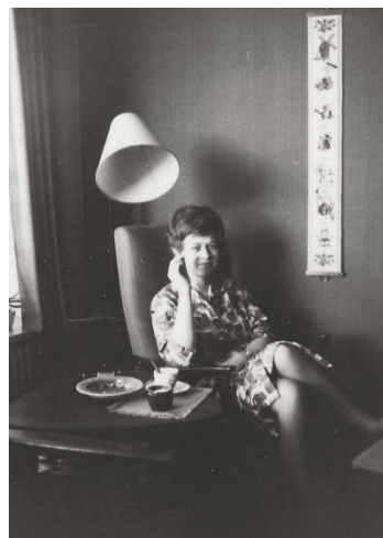
Klassekammerat på besøg.

Senere flyttes til en større lejlighed på Friggsvej.