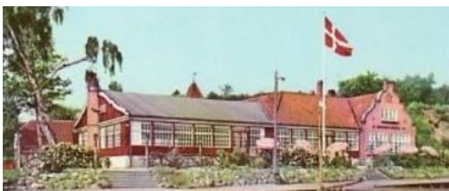
"Kongebrogården" i 1950- 1960'erne.