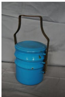
Pensionatsmaden blev afhentet i en sådan spand med plads til 3 retter.

Det blev ofte Gurli , der skulle "sætte kartofler over" som forberedelse til aftensmaden.