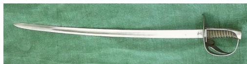
Sabel anvendt af dragoner.

2. Kavaleribrigade fik ordre om at forblive i Viborg, indtil samtlige jernbanetog med tropper og materiel havde passeret byen, og indtil alt mandskab og depoter var evakueret. Brigaden afmarcherede kl. 11½ til kartonnement nordvest for Skive, hvor man tog fat på forberedelserne til overførsel til Mors.