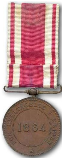
Erindringsmedalje for deltagelse i krigen 1864.