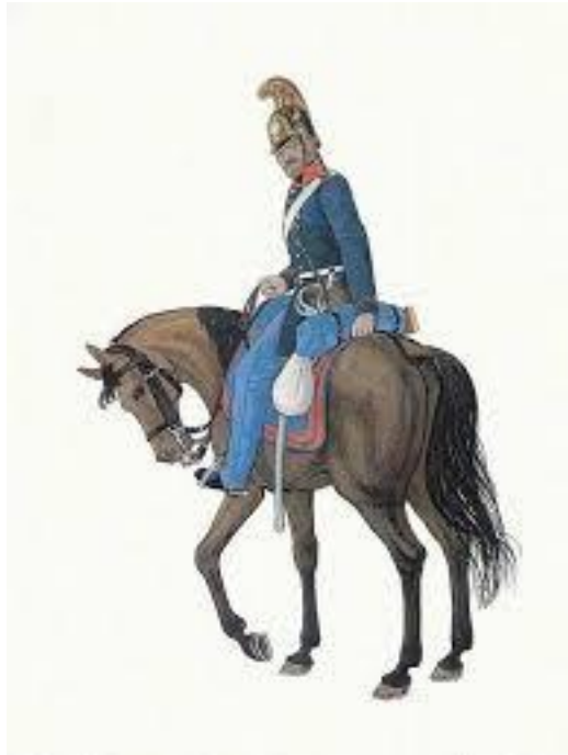
Dragon i uniform