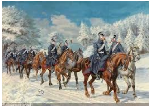
Dragonregiment på retræte.

2. Kavaleribrigade (med 6. Dragonregiment) skulle følge vejen over Alver til Kolding. Efter ankomsten "tog man kvarter" i byen. En enkelt Eskadron fra 6. Dragonregiment (ikke defineret) blev i Kolding. Resten gik i kvarter vest for chausséen til Vejle.