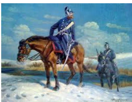
Dragoner på patrulje.

Stormen fortsatte og forhindrede stadig enhver forbindelse til Mors. Divisionen befandt sig i en kritisk situation, ventende et angreb af en stærkere fjende i fronten og med et vandløb i ryggen. Man fortsatte imidlertid med at skaffe transportmidler til Sallingsund.