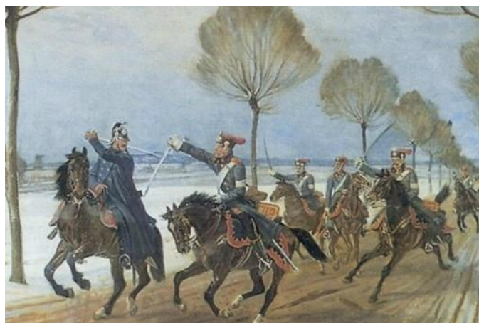
Dragon i kamp med østrigske husarer.

Situationen i 4. Division var efterhånden kritisk. Der var stor mangel på heste, ligesom mange heste var syge. Et regiment var uden støvler og såler. I en ordonnansafdeling var alle uden kapper, hvorfor de ridende var indhyllet i tæpper. Næsten alle manglede sporer og strigler, og kun halvdelen var forsynet med kardætsæsker (beholder til ammunition). Mange var uden valrapper (hestedækkener) og mantelsække (sække til rytterens beklædning), så de måtte have deres tøj i fourageersækken, så der ikke var plads til fourage – en tredjedel manglede sabelgehæng (sabelskeder), så de måtte have sablen i et reb om livet.