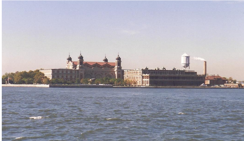
Ellis Island 1999.