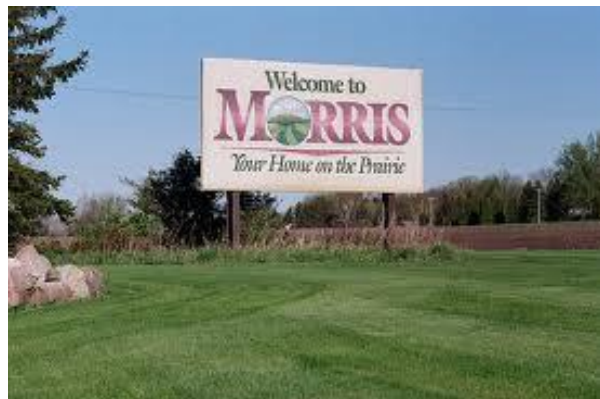
Morris, Minnesota, USA.