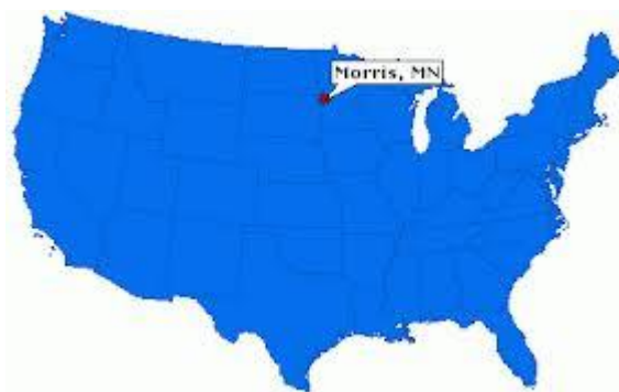
Morris, Minesota, - beliggenhed i USA.