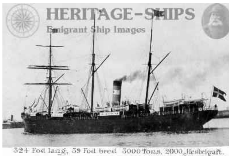
S.S. Island fra "Dampskibsselskabet Thingvalla.

Rederiet var stiftet af finansmanden C. F. Tietgen i 1880 og drev rutefart mellem bl. a. København og New York og Christiania (Oslo) og New York . I København havde rutedamperne anløbsplads på " Larsens Plads " (hvor nu Amaliehaven ligger). Rederiet blev senere overtaget af DFDS .