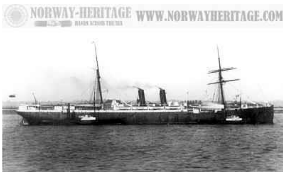
”S.S. Furnessia”, Anchor Line.