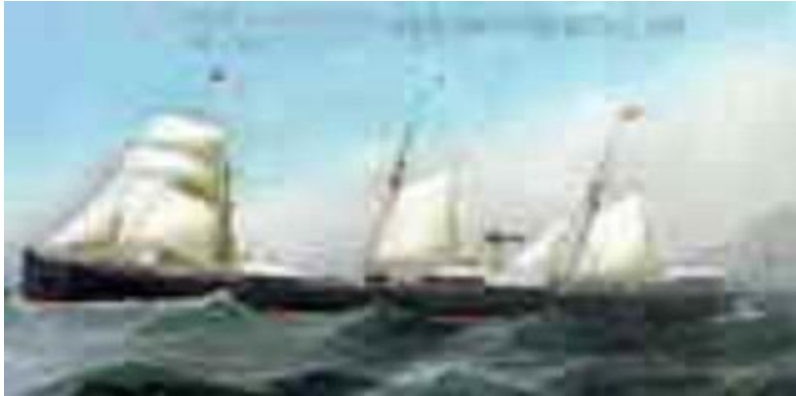
Maleri af "S.S. Island", Thingvalla Line.

"S.S. Island" havde plads til 1000 passagerer, 50 på 1. klasse, 50 på 2. klasse og 900 på 3. klasse. Skibet anløb New Yorks havn den 1. juni 1902 efter en sørejse over Atlanten på 18 døgn. Skibets kaptajn var ansvarlig for udfærdigelse af en fyldig passagerliste, der indeholdt følgende 21 punkter: