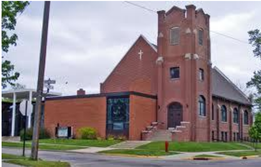
First Lutheran Church i Morris Minnesota.