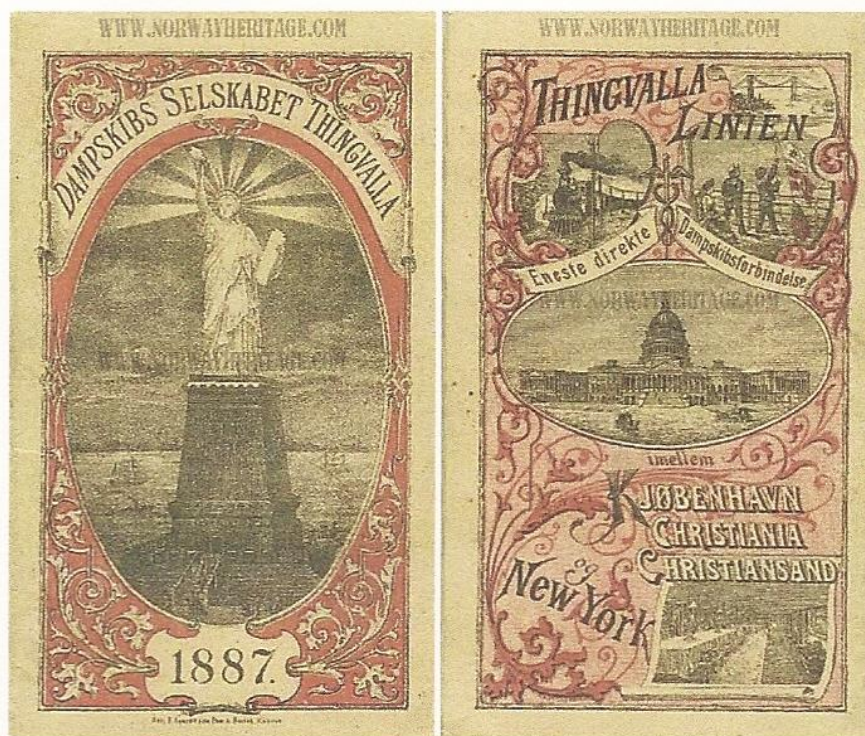
Brochure fra Dampskibs Selskabet Thingvalla – Thingvalla Linien. Eneste direkte Dampskibsforbindelse mellem København, Christiania, Christiansand

Rederiet var stiftet af finansmanden C. F. Tietgen i 1880 og drev rutefart mellem bl. a. København og New York og Christiania (Oslo) og New York . I København havde rutedamperne anløbsplads på " Larsens Plads " (hvor nu Amaliehaven ligger). Rederiet blev senere overtaget af DFDS .