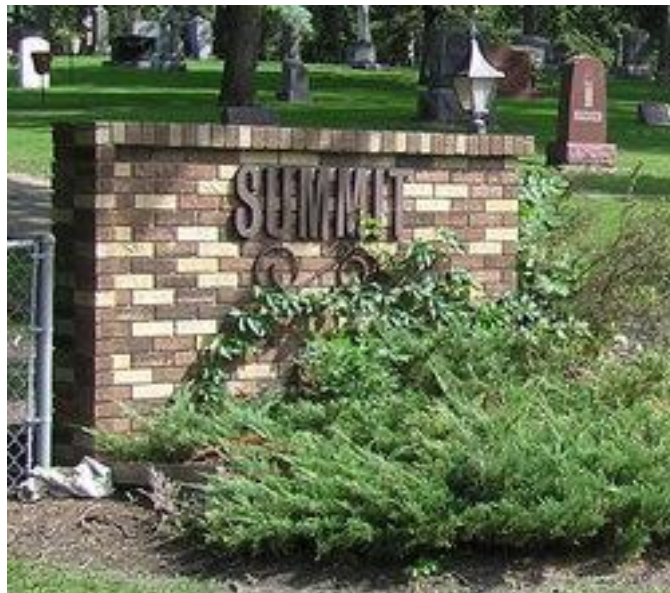
Summit Cemetery, Morris Minnesota.