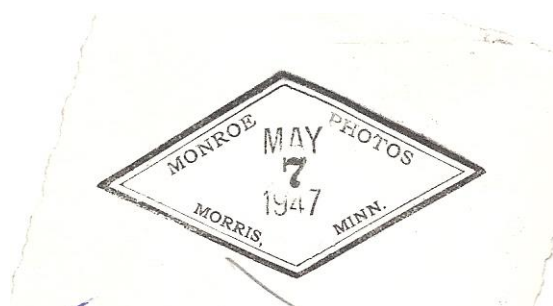
Stemplet på et billedes bagside.

På bagsiden af et af fotografierne fandtes et stempel ( Monroe Photos – MAY 7 1947 Morris, Minn. ).