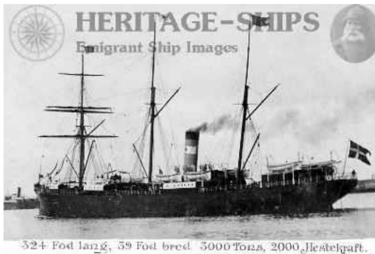
S.S. Island fra ” Dampskibsselskabet Thingvalla ”.

Det var bygget på B & W i København i 1882 til ” Dampskibsselskabet Thingvalla ”.