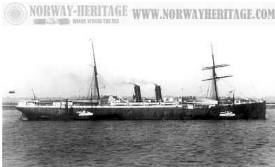
” S.S. Furnessia ”, Anchor Line .