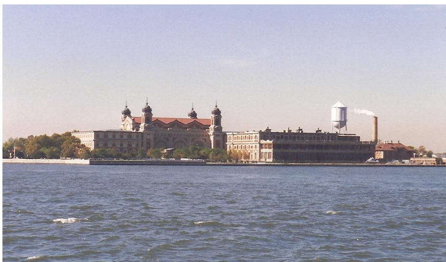
Ellis Island 1999.

Af Marie Andersens nekrolog fremgik det, at hun var kommet til USA i en alder af kun 16 år. Næste skridt var derfor at lede efter hende i Ellis Islands arkiver ( Ellis Island – beliggende ud for New Yorks havn – tæt ved øen med Frihedsgudinden – var i perioden 1892 – 1954 ”modtagestation” for nye immigranter til USA ).