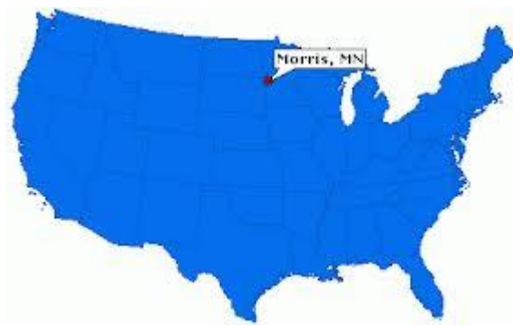
Morris, Minesota, - beliggenhed i USA.