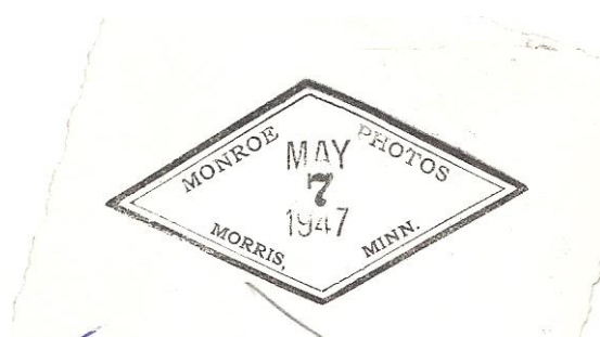
Stemplet på et billedes bagside.

På bagsiden af et af fotografierne fandtes et stempel ( Monroe Photos – MAY 7 1947 Morris, Minn. ).