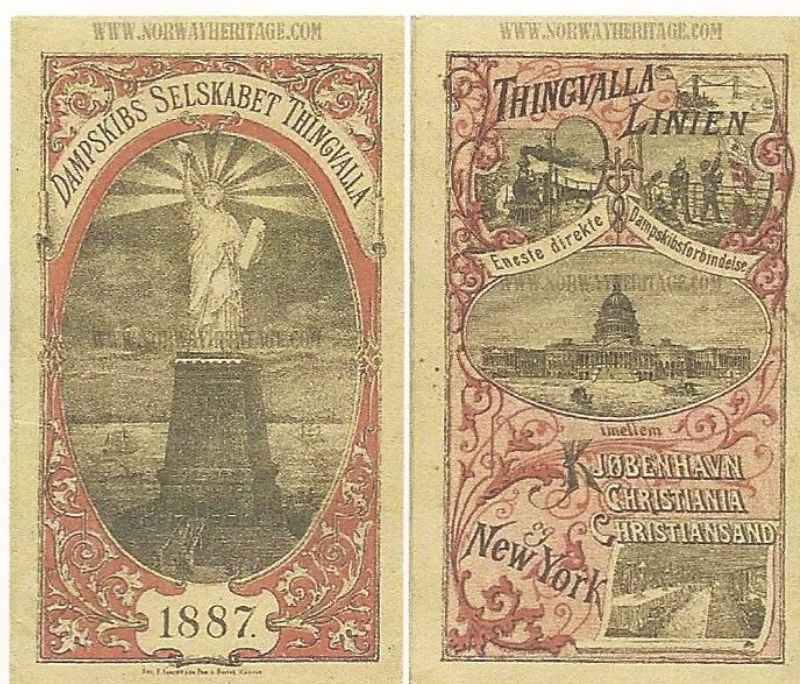
Brochure fra Dampskibsselskabet Thingvalla – Thingvalla Linien.

Rederiet var stiftet af finansmanden C. F. Tietgen i 1880 og drev rutefart mellem bl. a. København og New York og Christiania (Oslo) og New York . I København havde rutedamperne anløbsplads på ” Larsens Plads ” (hvor nu Amaliehaven ligger). Rederiet blev senere overtaget af DFDS .